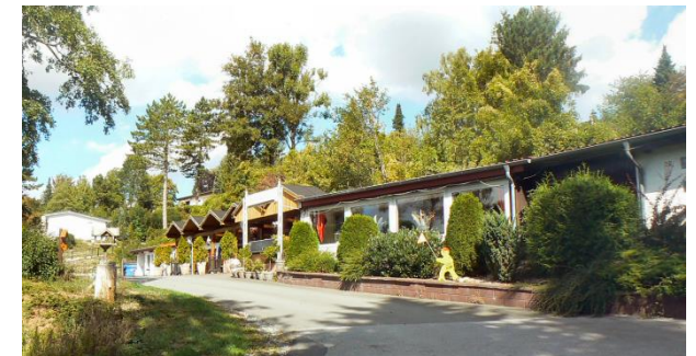
Das Grand-Café / Restaurant „Vagenbond“ bietet eine breite Palette an Speisen und Getränken zu familienfreundlichen Preisen